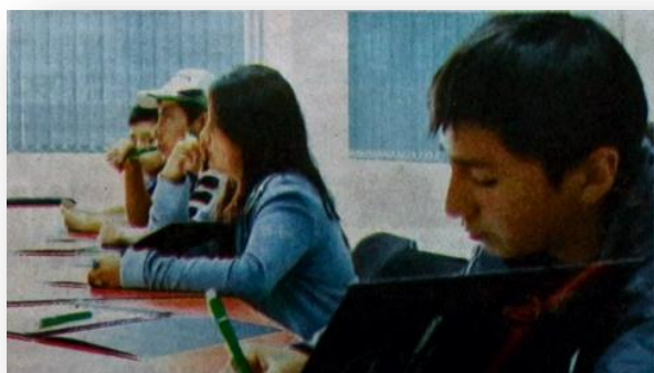
❖ Estudiantes pertenecientes al Sisbén 1 y 2

La Udenar ha diseñado unas estrategias educativas flexibles como resultado de múltiples investigaciones, especialmente la realizada en el marco de la investigación 'Programa Marco Interuniversitario para una Política de Equidad y Cohesión Social en la Educación Superior - Riaipe III, financiado por Alfa III' que brinde a los jóvenes oportunidades académicas y al mismo tiempo oportunidades laborales. See for more