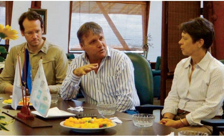
La embajadora visitó las instalaciones de la Corporación Autónoma Regional de Risaralda, CARDER.

La embajadora, quien se mostró complacida por estar en las instalaciones de la CARDER, también hizo un recorrido por algunos aprovechamientos forestales en la capital risaraldense, con el fin de