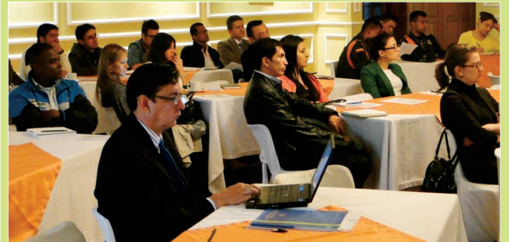
Los asistentes acudieron al evento para avanzar en la construcción de acciones que visibilicen el Pacto.

Nuevos aportes para la Estrategia de Comunicación del Pacto Intersectorial por la Madera Legal en Colombia y las bases para el Plan de Acción de la misma en el 2014, surgieron del reciente taller realizado en Bogotá, con los comunicadores y otros representantes de las entidades firmantes del Pacto.