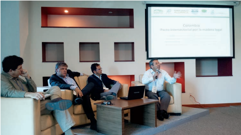
Participación de representantes de Colombia en el intercambio de Experiencias entre Países Sur - Sur

La propuesta de implementar el sistema de control y vigilancia forestal que en la actualidad se encuentra en fase de ajuste técnico, le permitirá a las Corporaciones Autónomas Regionales socias del Proyecto, dar un paso importante en pos de la legalidad forestal, pero el proceso todavía