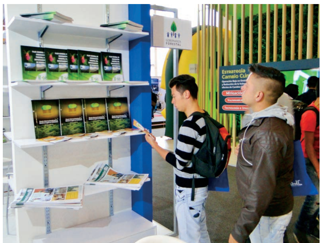
El Proyecto Posicionamiento de la Gobernanza Forestal en Colombia tuvo su espacio en el stand de la Unión Europea.

Es así como se explicó que el PPGFC, con el fin de obtener información sobre el comportamiento de los diferentes elementos de la cadena forestal, se propuso calcular el valor comercial de la madera que se extrae anualmente en Colombia de los bosques naturales con base en permisos y autorizaciones de aprovechamiento forestal otorgados por las