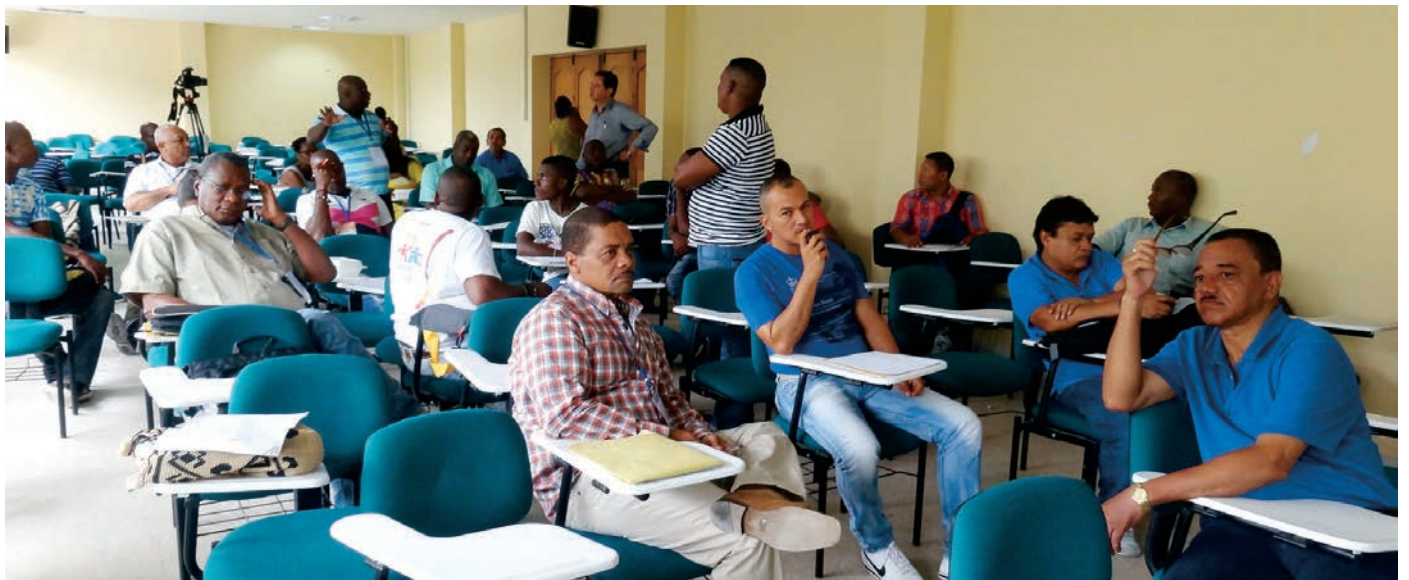
En el evento participaron 79 actores nacionales, regionales y locales de la región.

Finalmente, los productos obtenidos por cada una de las mesas de trabajo, como también los considerandos propuestos para la creación de la Mesa Regional Forestal, fueron expuestos en plenaria y posteriormente llevados a votación oral para ser incorporados como parte del Acta de Creación de la Mesa Forestal para el Departamento del Chocó.