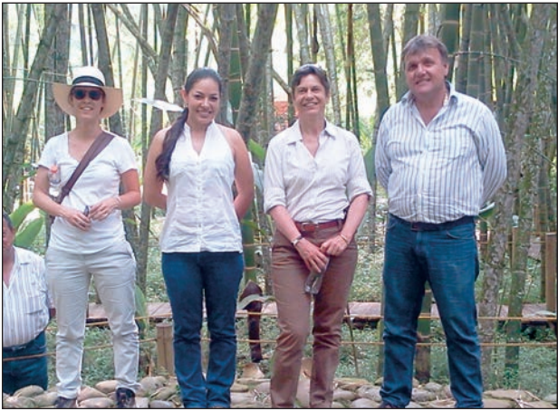
La embajadora visitó algunos guaduales certificados en la región

conocer el proceso que se adelanta con la guadua, ya que este es un recurso natural, de tradición en el Eje Cafetero.