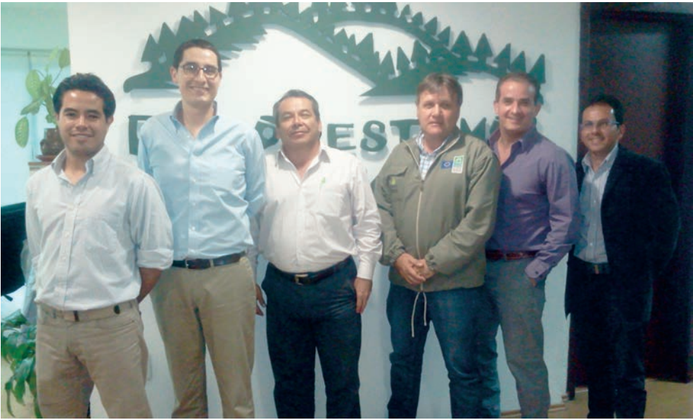
Delegados del Proyecto y de la CARDER se reunieron con directivos de la ONG Reforestamos México

La Secretaría de Ambiente y Recursos Naturales de México, compartió experiencias relacionadas con el documento que autoriza la movilización de productos maderables en ese país, el cual tiene elementos de seguridad que son visibles a luz ultra violeta, pero es importante llamar la atención que este documento no tiene valor para el actor forestal. En cuanto a los actos administrativos que se expiden para el aprovechamiento forestal, estos se pueden revisar en la página web de la Secretaría, lo cual facilita las labores de control y vigilancia forestal.