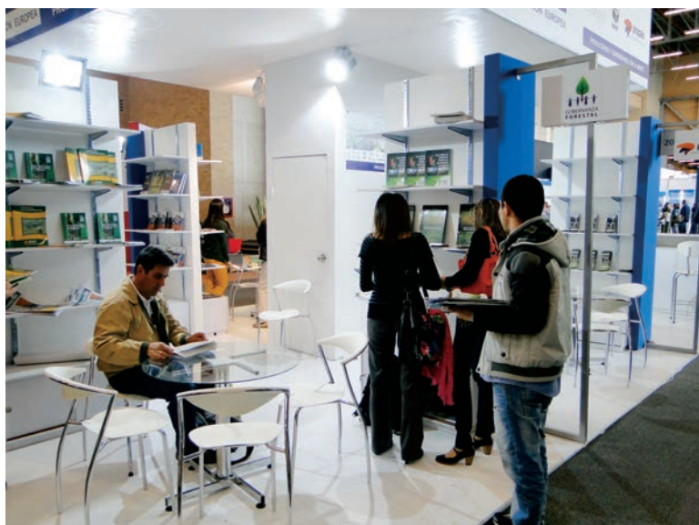
En el stand de la Unión Europea participaron 6 proyectos ambientales.

De esta manera la participación del Proyecto fue de gran importancia, y así como lo indica la Feria en su portal web, FIMA es en Suramérica, la principal plataforma para la promoción de bienes y servicios, y la divulgación de Programas y Proyectos que fomentan el cuidado, la conservación y recuperación de los recursos naturales y el medio ambiente.