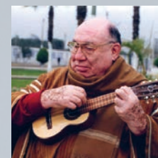
Jaime Guardia, 1933

Maestro charanguista con setenta años de vida artística, y uno de los principales promotores de la música andina. José María Arguedas le dedicó Todas las sangres.