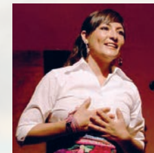
Magaly Solier, 1986

Cantautora y actriz. Su primer disco, Warmi, obtuvo el Premio Lucas. Sus interpretaciones en La Teta Asustada y Amador han sido galardonadas en destacados festivales.