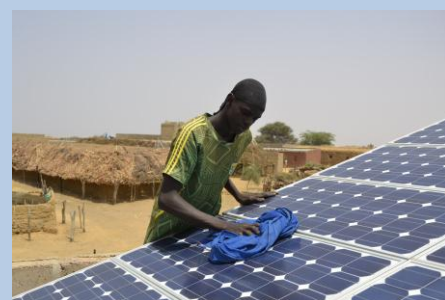
Mauritania 9 ACP RPR 49-30 - PERUB

DG développement et coopération - EuropeAid