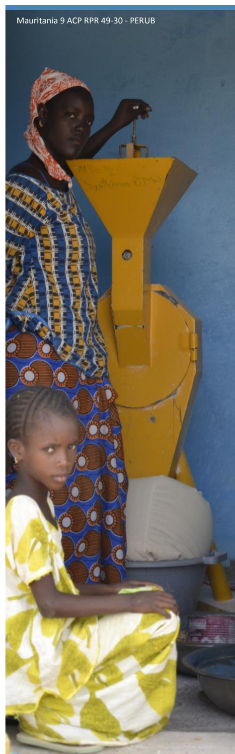
Mauritania 9 ACP RPR 49-30 - PERUB

DG développement et coopération - EuropeAid