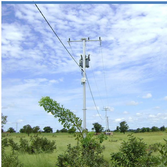
Benin Burkina Faso WAPP 9 ACP RPR 49-39

DE LA FACILITE ENERGIE ACP-UE DANS LE 10 ÈME FED !