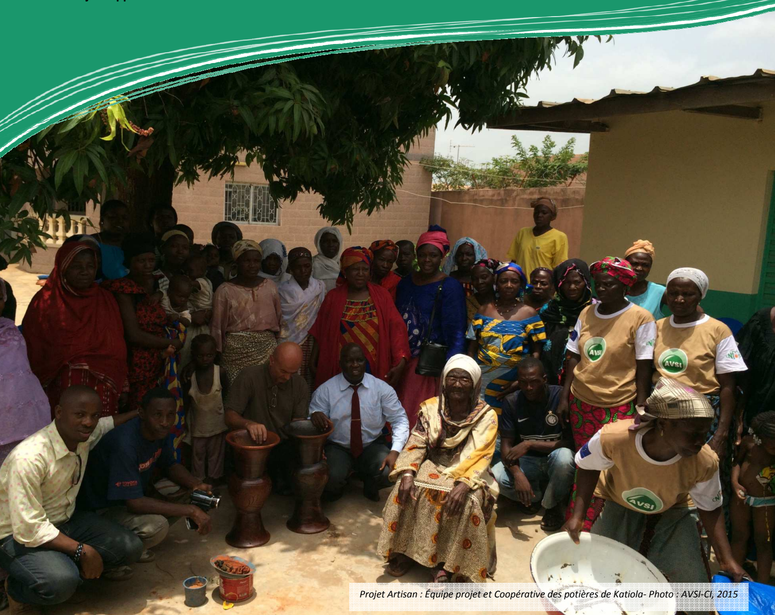
Projet Artisan : Équipe projet et Coopérative des potières de Katiola- Photo : AVSI-CI, 2015