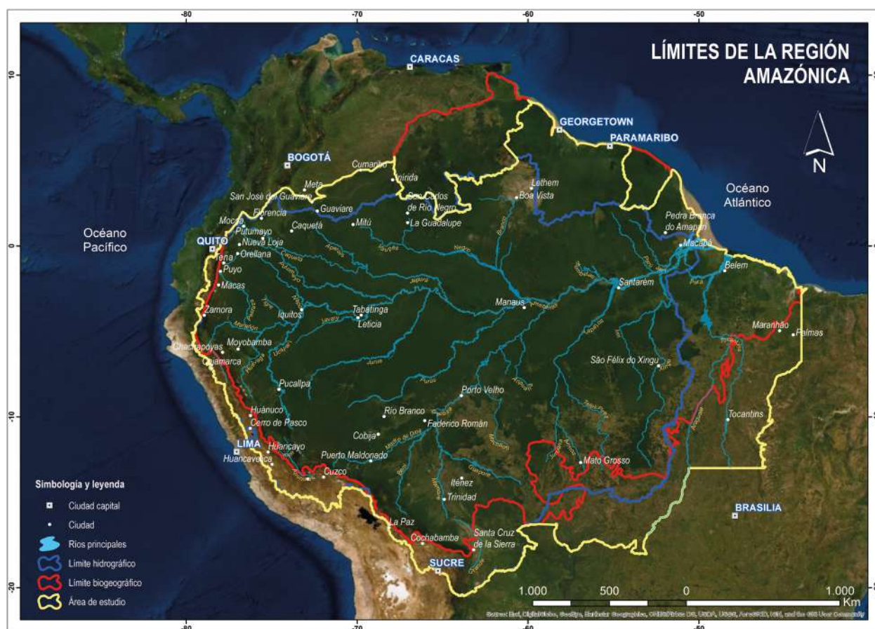
Límites de la región Amazónica. Imagen: OTCA y CIIFEN (2020).