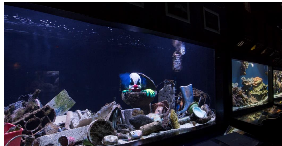
Profanation - © Musée océanographique - Michel Dagnino

Retrouvez les coulisses de la réalisation du bassin « Profanation » ici : http://youtube.com/MonacoOceano