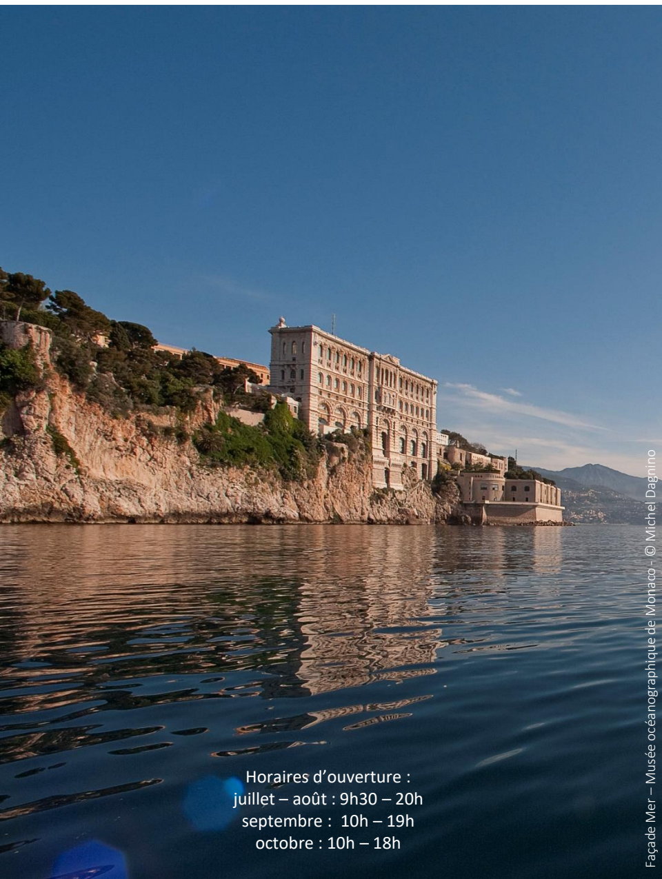
Façade Mer – Musée océanographique de Monaco – © Michel Dagnino

Horaires d'ouverture : juillet – août : 9h30 – 20h septembre : 10h – 19h octobre : 10h – 18h