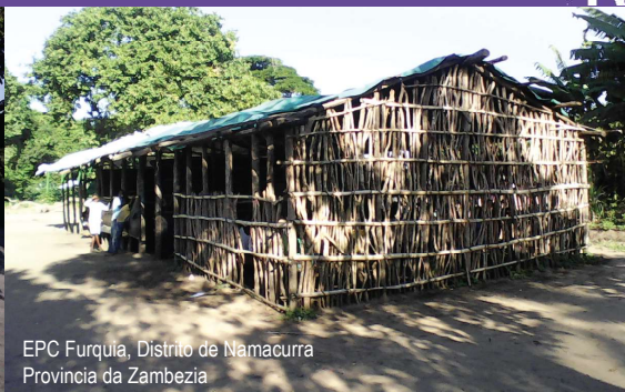
EPC Furquia, Distrito de Namacurra Província da Zâmbia