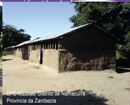
EPC Mazoao, Distrito de Namacurra Província da Zâmbia