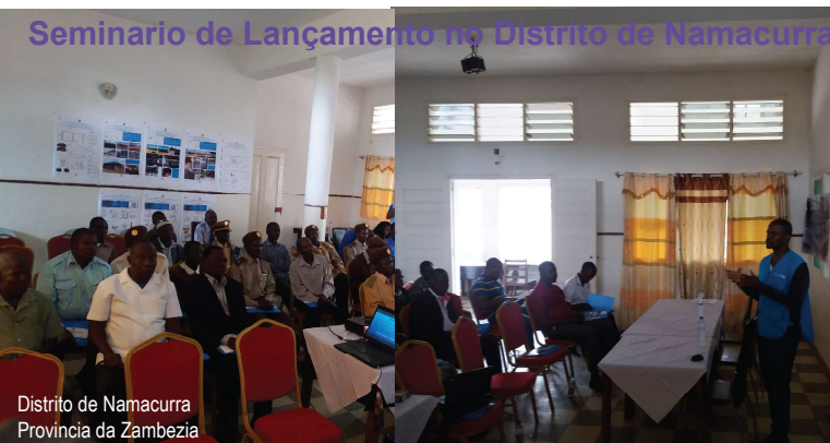
Distrito de Namacurra Província da Zâmbia