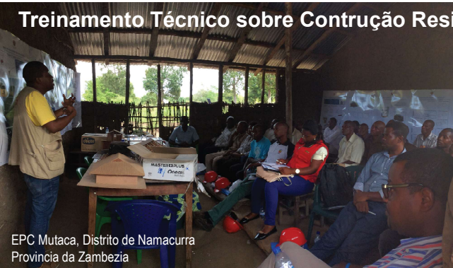
EPC Mutaca, Distrito de Namacurra Província da Zâmbia