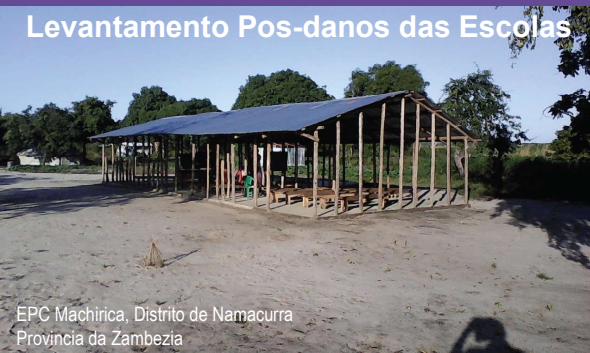
EPC Machirica, Distrito de Namacurra Província da Zâmbia