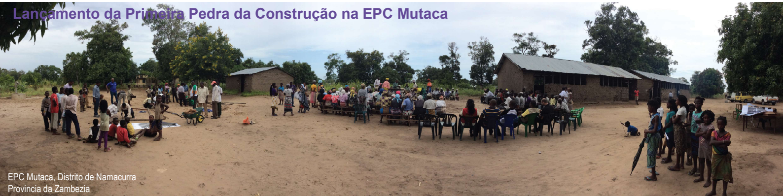
EPC Mutaca, Distrito de Namacurra Província da Zâmbia